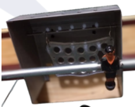
ARCOS CON CAMPANA