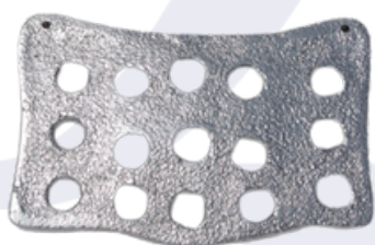
CAMPANA DE ALUMINIO